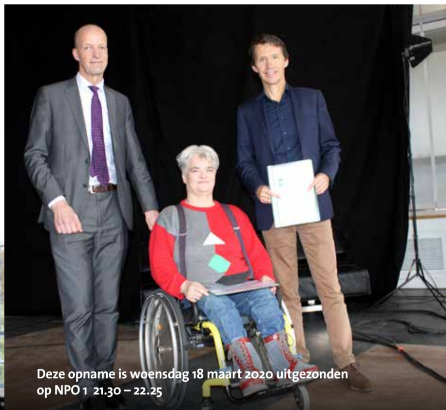
Deze opname is woensdag 18 maart 2020 uitgezonden op NPO 1 21.30 – 22.25

De zaak handelt om angst en onduidelijkheid, met betrekking tot een code over veilig vervoer van rolstoelgebruikers in onze taxibranche en de naleving hiervan, waarbij (zo blijkt na de uitspraak des te meer) een ieder het beste voor heeft.